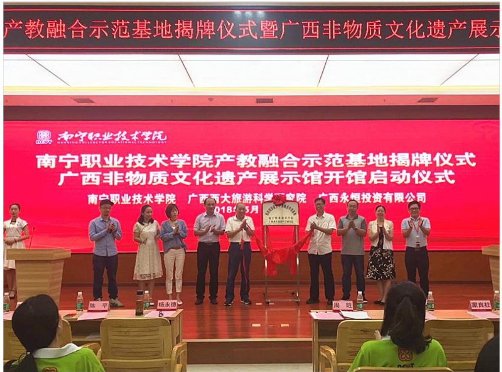
图 1. 旅游规划设计产教融合示范基地揭牌仪式