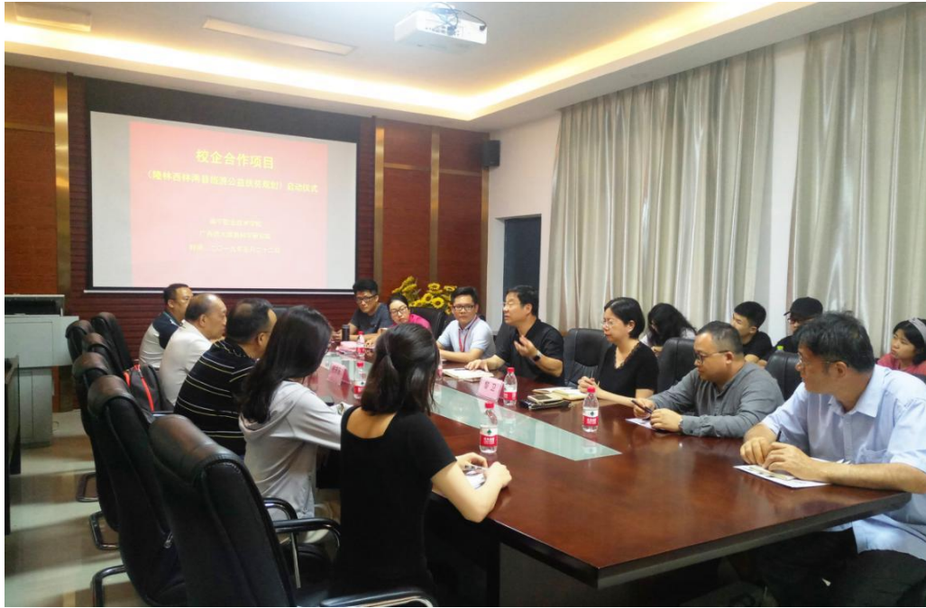
图 3. “校企合作项目（隆林西林两县旅游公益扶贫规划）”启动仪式顺利举行

学校企合作特色。以“点”“面”结合，校企共同、联合对学生开展双向培养，以点带面，校内外实训室联动，多设计组共同推进项目实施，以此推动整个专业群建设全面发展。