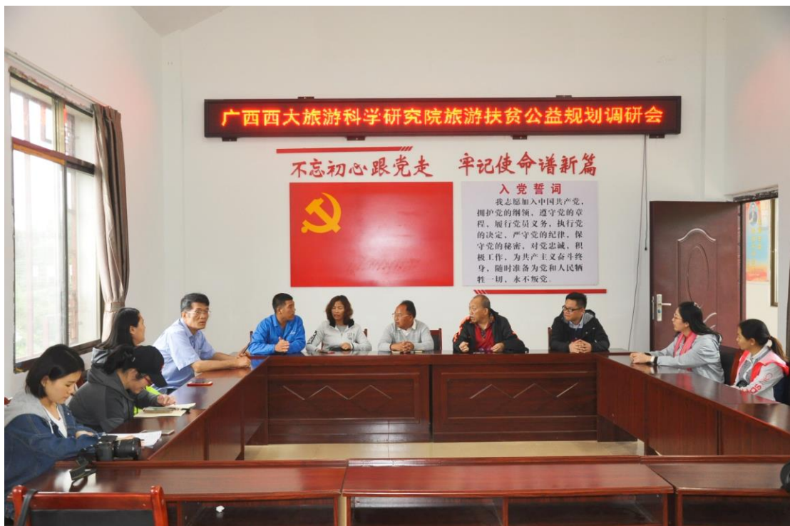
图 8. 与西林足别乡央龙屯相关领导就致贫原因进行座谈