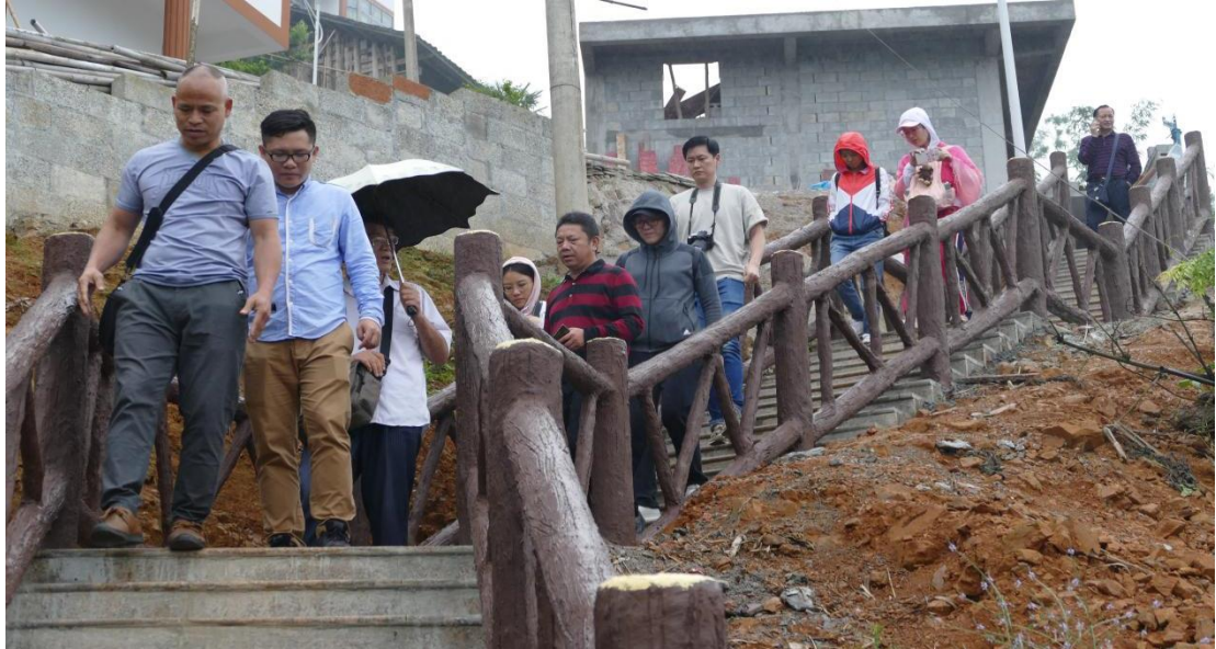
图 7. 建筑室内设计专业群成员在村干部和涉农企业负责人的陪同下走访晓云屯

山银山”的有效脱贫方式，提出“政府支持、企业引领、贫困群众参与”的旅游扶贫模式，以现有产业为基础，发展康养新业态。