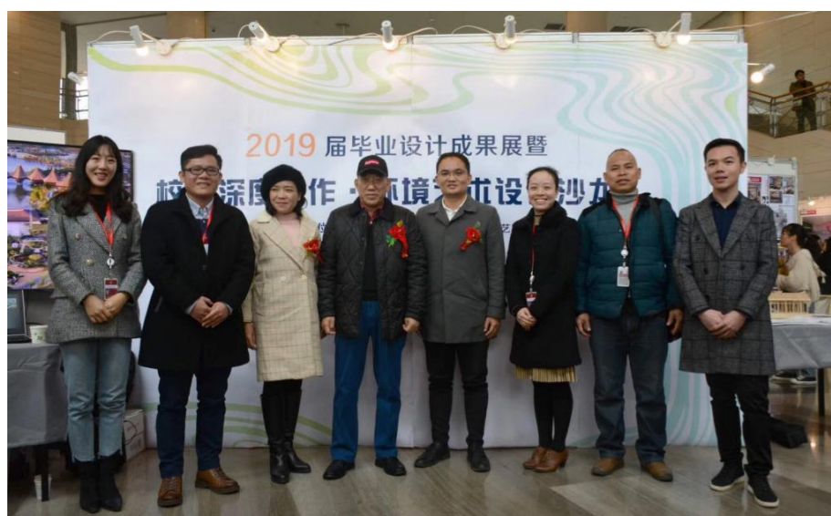
图 4. 2019 届环境艺术设计毕业设计展暨“校企深度合作·环境艺术设计沙龙”现场

2018 年开展 2019 届环境艺术设计毕业设计展暨“校企深度合作·环境艺术设计沙龙”，是我院首届以毕业设计展现场搭建的学术交流平台，也是与校企合作共建的一次大型设计沙龙活动。拓展我院与广西知名企业在景观、建筑设计理念上的交流互动，也加强职业教育与科研的交流与合作，提高行业企业岗位需求，推动高技能人才培养。